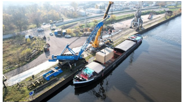
Verladung eines 200-Tonnen-Generators im Hafen Lovosice